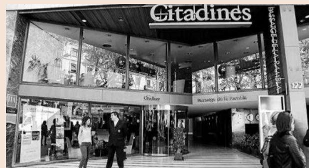
Levi's abrirá en los bajos del Hotel Citadines.

más representativas de la firma en el mercado español. En la capital catalana Levi's ya cuenta con seis establecimientos, mientras que en Madrid sólo opera con dos tiendas, situadas en centros comerciales. Otras marcas de moda como Nike, Custo Barcelona, Desigual, y más recientemente, Mango, también apuestan por Las Ramblas para sus tiendas.